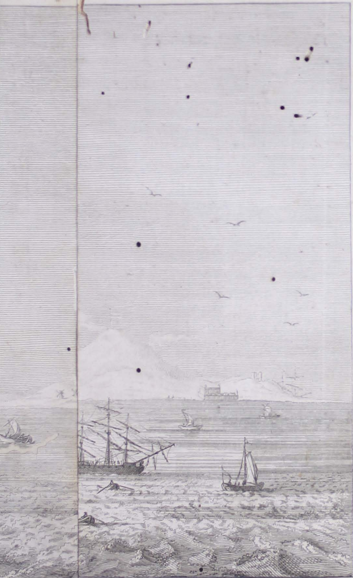
Vue des des nuages. du Sud-Est.