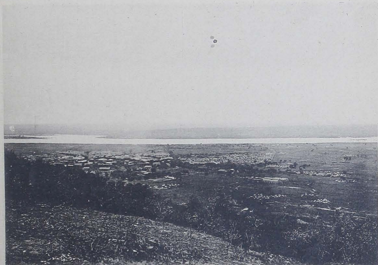
FIG. 8. — Bamako et la vallée du Niger, vue prise de Koulouba.