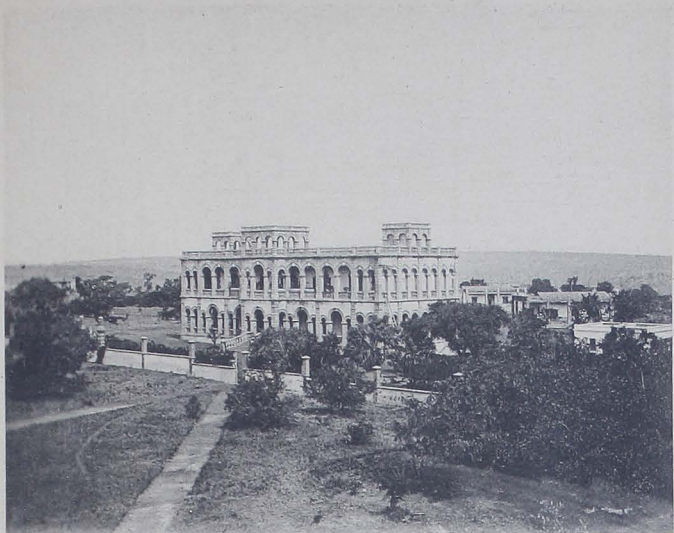
FIG. 7. — L'Hôtel du Secrétaire Général, à Koulouba.